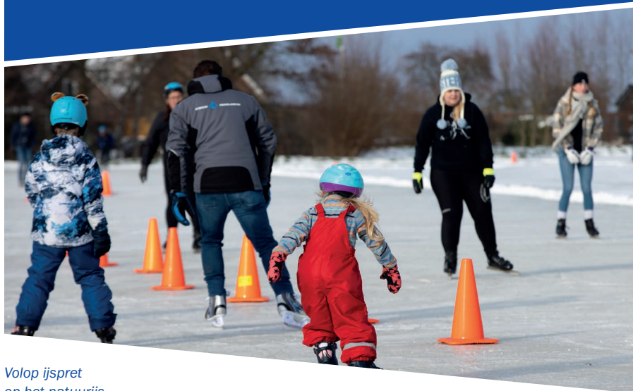
Volop ijspret op het natuurijs

Dankzij het voorbereidende werk van de sectie natuurijs en het KNSB-bonds bureau hadden de natuurijsverenigingen coronaprotocollen, een online reserveringssysteem, informatiematerialen, draaiboeken en social media communicatie via #wijsopnatuurijs , zodat er coronaproof geschaatst kon worden. Heel bijzonder én vooral heel vertrouwd waren de inspanningen van de vele vrijwilligers bij de natuurijsclubs die vaak ook 's nachts gewerkt hebben aan het voorbereiden van een natuurijsbaan.