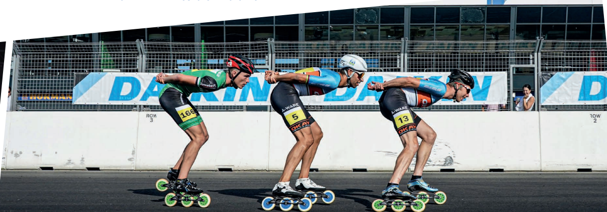
Circuit Zandvoort, Daikin NK Inlineskaten Marathon